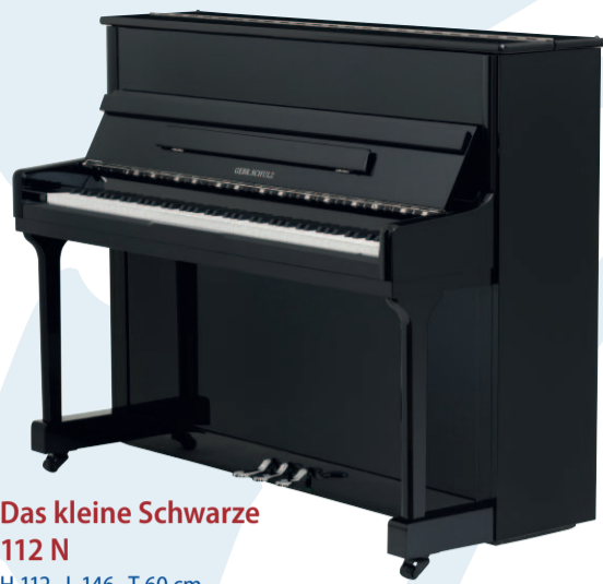
Das kleine Schwarze 112 N