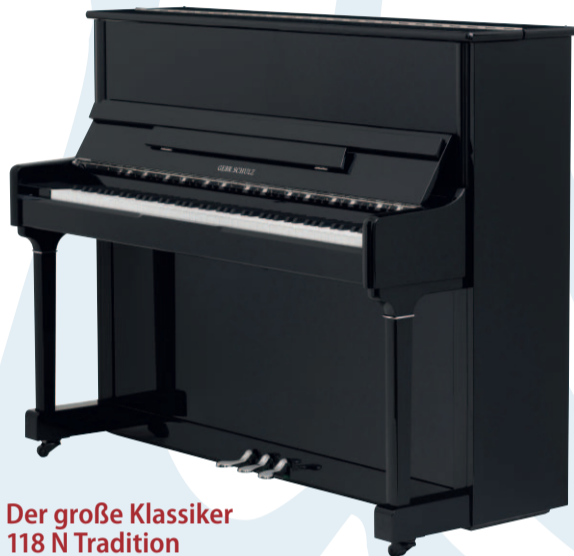
Der große Klassiker 118 N Tradition

Unser zierliches Klavier in klassischer Form vereint solide Konstruktion mit tragfähigem Klang. Sein günstiger Preis macht es zu einem gefragten Einsteigermodell.